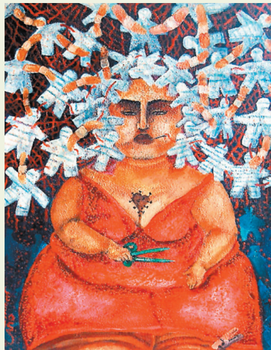
Recortes de Hubert Caño

Para más información o boletos, favor de llamar a 787-758-8150 .