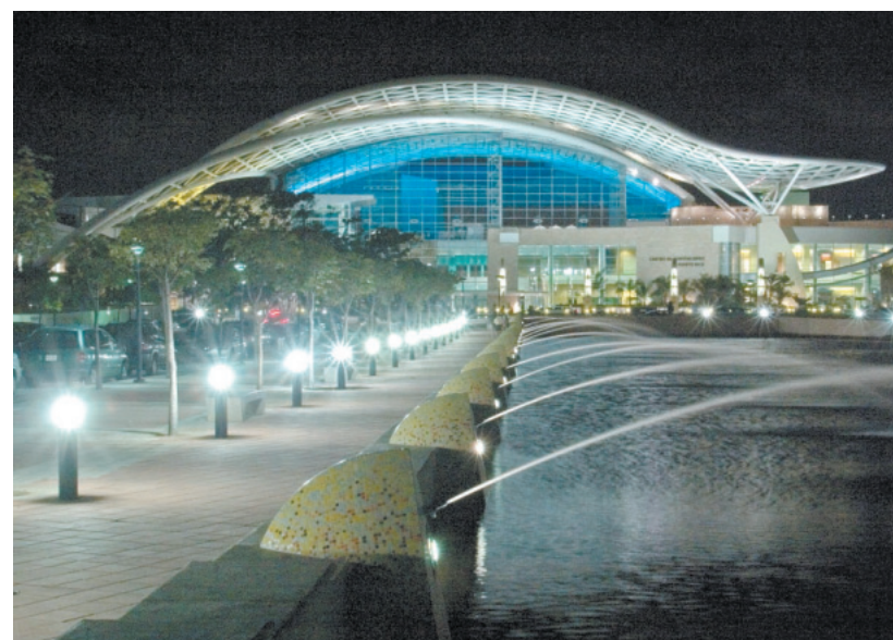
El arquitecto asegura que ser puertorriqueño ha sido siempre un punto de ventaja.