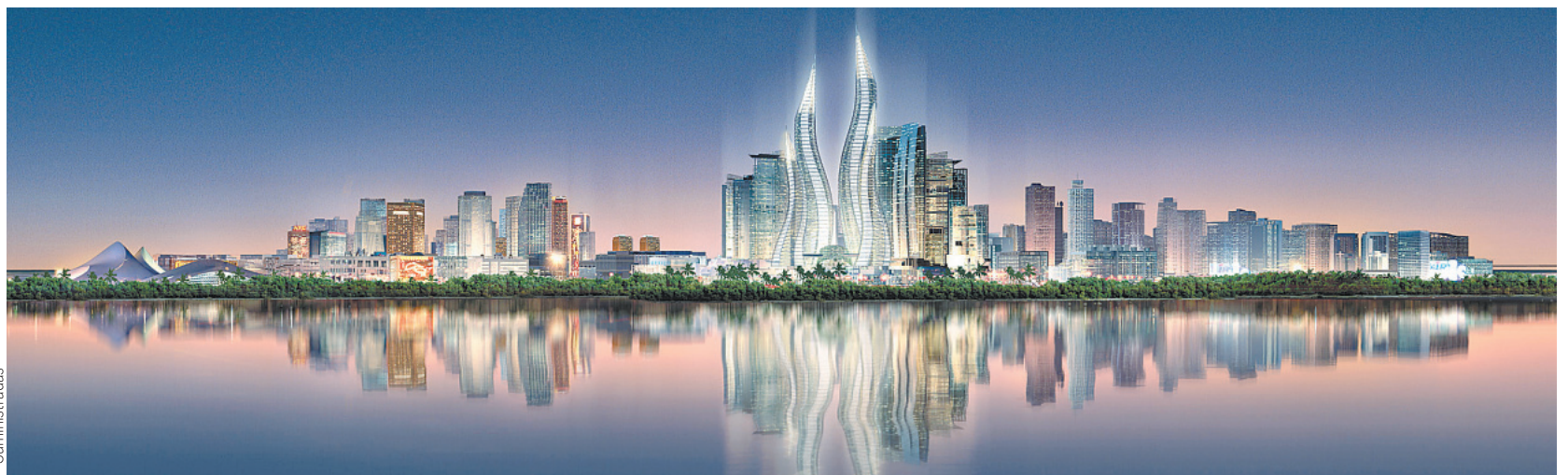
Así es como se verán la Torres de Dubái en el complejo Las Lagunas. El país es uno de los más modernos y progresistas de los siete Emiratos Árabes Unidos.

Y esto, expresado por un egresado del Colegio Espíritu Santo, de Río Piedras, vale más que todo el oro del moro.